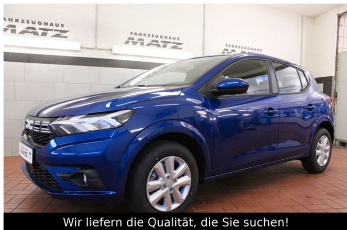
Wir liefern die Qualität, die Sie suchen!