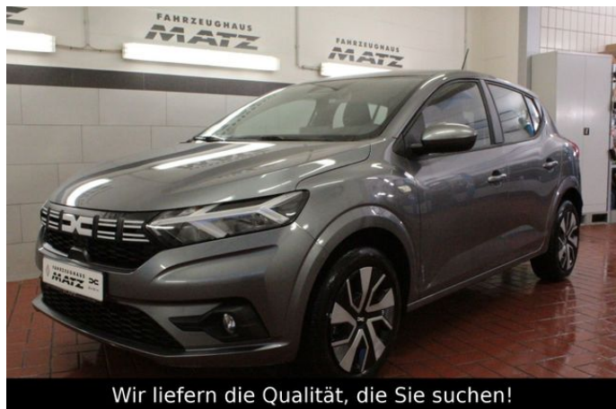
Wir liefern die Qualität, die Sie suchen!