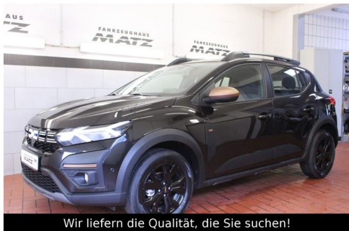
Wir liefern die Qualität, die Sie suchen!