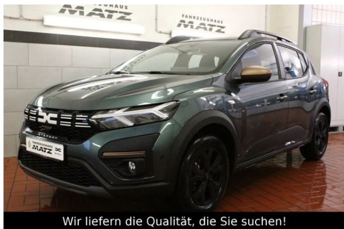
Wir liefern die Qualität, die Sie suchen!