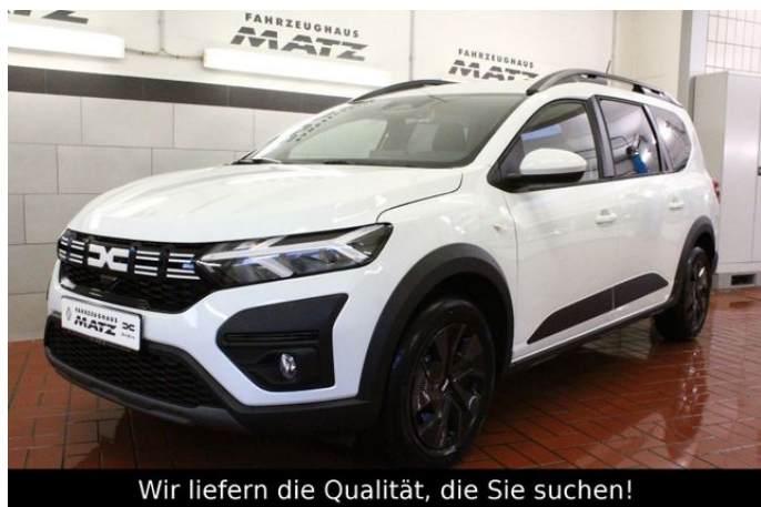
Wir liefern die Qualität, die Sie suchen!