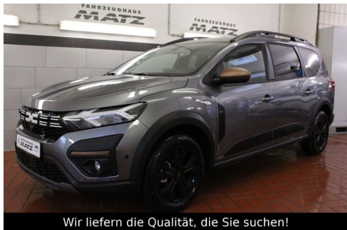
Wir liefern die Qualität, die Sie suchen!